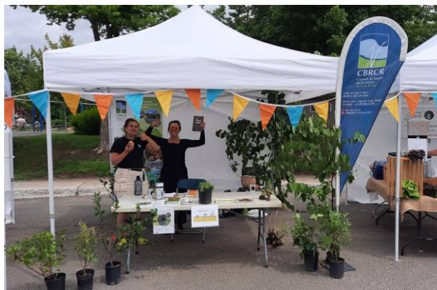
Marché public de Cap-Rouge juillet